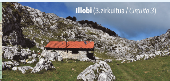
Illobi (3.zirkuitua / Circuito 3)