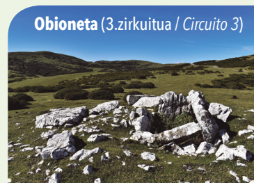
Obioneta (3.zirkuitua / Circuito 3)