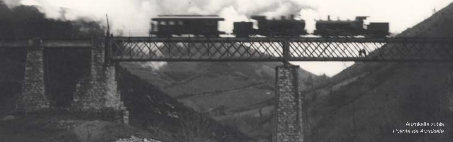
Auzokalte zubia Puente de Auzokalte

Este tren de vía estrecha fue construido como prolongación de un primitivo tren minero que unía la estación de la Compañía del Norte en Andoain (Gipuzkoa), con las minas de Plazaola (yacimientos de Bizkotz), en el valle del Leitzaran. Estuvo en funcionamiento hasta 1953, año en el que dejó de dar servicio. La construcción no estuvo exenta de dificultades, ya que la línea debía superar la notable diferencia de cota existente entre Pamplona-Iruña y Donostia/San Sebastián. Entre las numerosas obras, destacada la del túnel de Uitz, con una longitud total de 2.700 metros. Las obras concluyeron el 19 de enero de 1914 y, a partir de entonces, se estableció un servicio de viajeros con tres circulaciones diarias, en cada sentido, entre Pamplona-Iruña y Donostia/San Sebastián, que se reforzaban si la demanda lo exigía, por ejemplo, durante las populares fiestas de San Fermin. Antiguas estaciones, apeaderos, túneles y puentes conforman un patrimonio cultural e industrial que hablan del pasado reciente de esta línea férrea, que gracias a la transformación en vía verde hoy podemos contemplar y disfrutar.